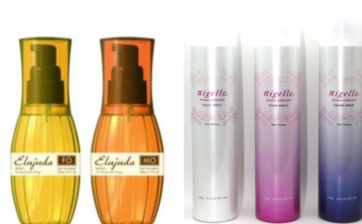
＜ディーセス エルジュータ＞ ＜ニゼルドレシアコレクション スプレーシリーズ＞